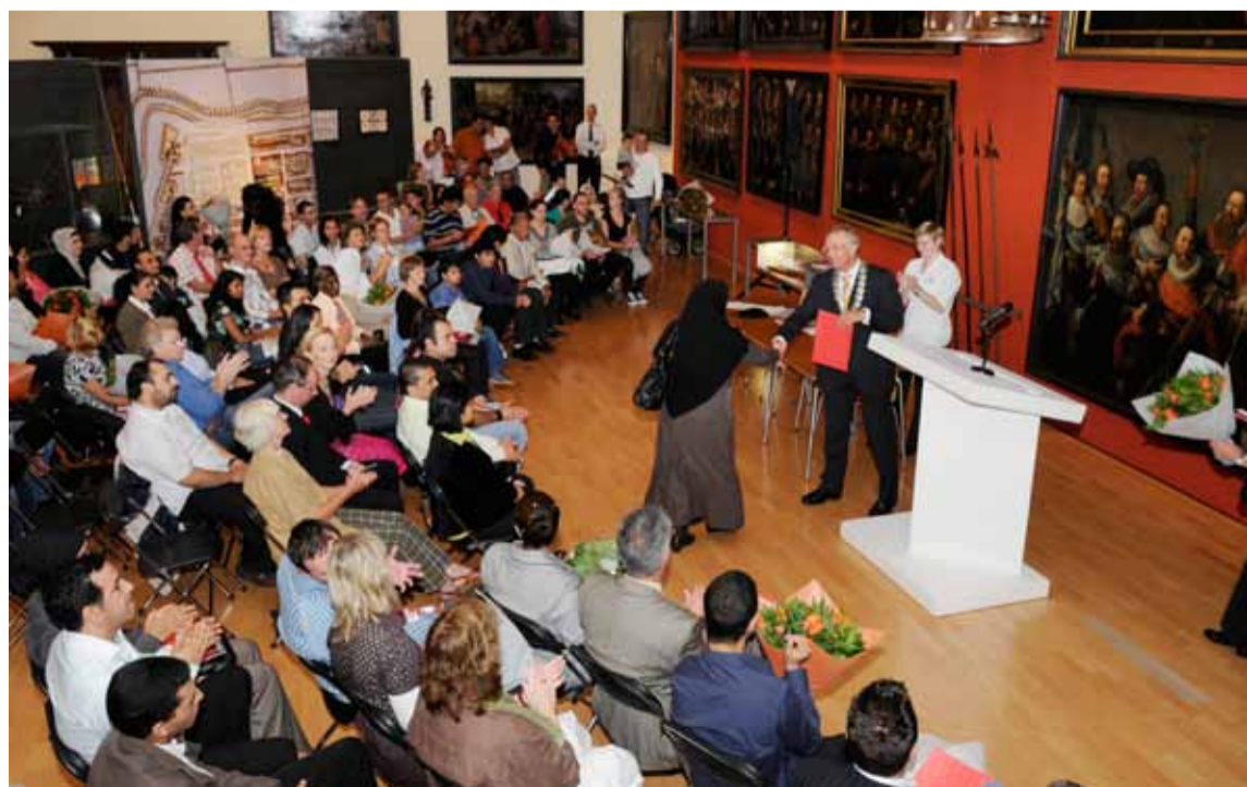
Naturalisatieceremonie in het Stedelijk Museum

Geen brief meer de deur uit die niet leesbaar is of in ambtelijke taal is geschreven. Om dit waar te maken hebben alle medewerkers van sector Publiekszaken