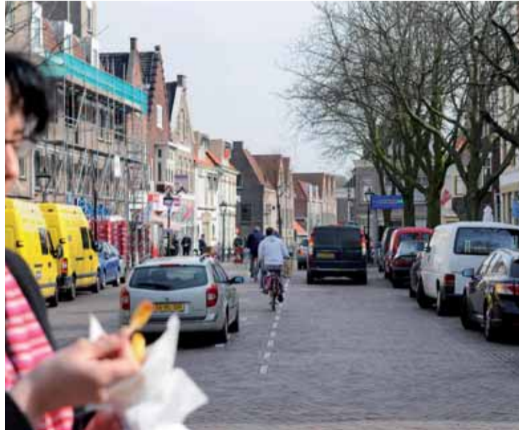
De Dijk is straks leefbaarder

Vorig jaar besloot het college van burgemeester en wethouders, na een proef van drie maanden, om de Dijk af te sluiten voor doorgaand verkeer. Metingen voor en tijdens de proef lieten zien dat de afsluiting een gunstig effect heeft op de leefbaarheid op de Dijk. Ook is afgesproken de parkeerplaatsen op de Dijk op te heffen en een officiële taxistandplaats aan te leggen aan de Kanaalkade.