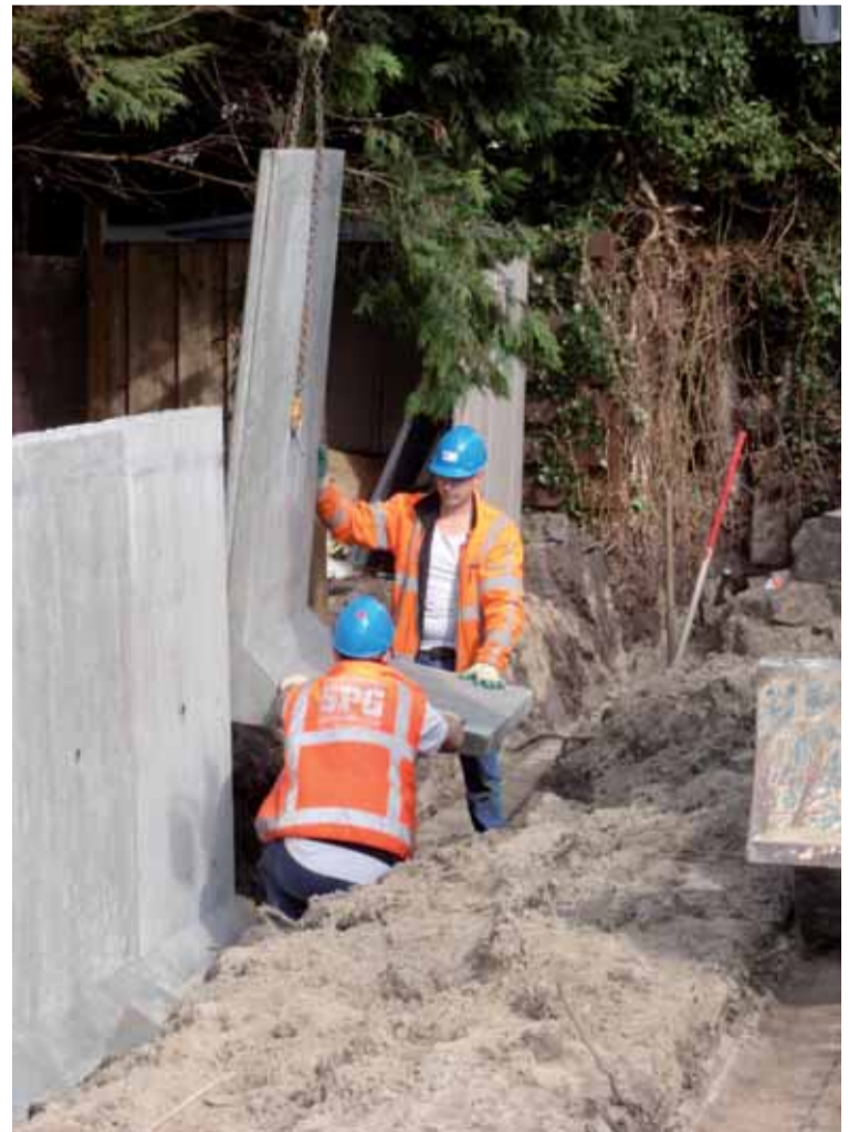
Leerlingen SPG plaatsen erfafscheiding schoolplein Bello.

Wijkvereniging 'Op de Rails' heeft een belangrijke rol gespeeld bij de herinrichting van het schoolplein. Eerst bij de bouw van een nieuwe gymzaal op het terrein en nu bij de aanleg van het nieuwe plein. Een plein dat niet alleen voor Bello van grote betekenis is, maar ook voor de Spoorbuurt. De leerlingen en ouders van de school en de bewoners van de Spoorbuurt hebben allen inspraak gehad bij het ontwerp van het plein. Dit vergroot de verantwoordelijkheid voor het beheer ervan. Vanaf eind juni is het schoolplein helemaal klaar en kunnen de Bello-leerlingen en kinderen uit de buurt hier spelen. De samenwerking tussen gemeente, opleidingsbedrijven, Bello en de wijkvereniging maken dit project bijzonder en op alle fronten succesvol.