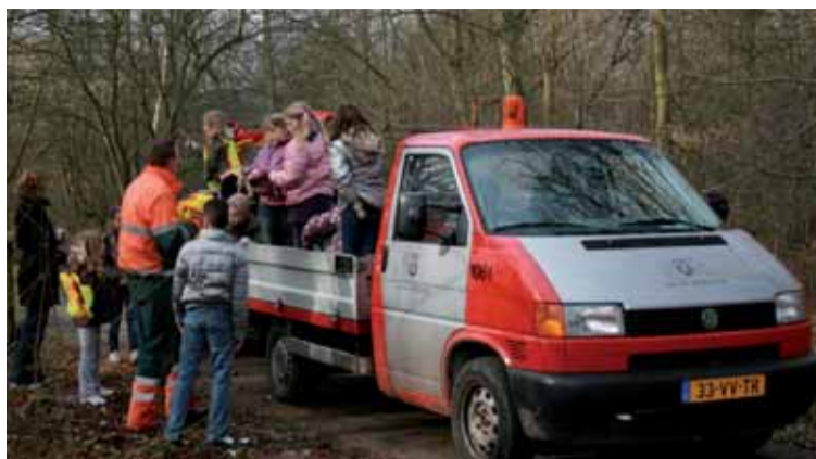
Schoolkinderen in De Hoef helpen bij het verwijderen van zwerfvuil