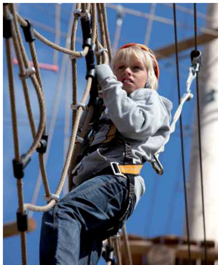
Kijk voor meer informatie op www.outdoorparkhoornsevaart.nl

Entreprijzen liggen tussen de € 6,- tot € 17,50 p.p. Het klimpark is vrij toegankelijk voor iedereen die eerst wil komen kijken.