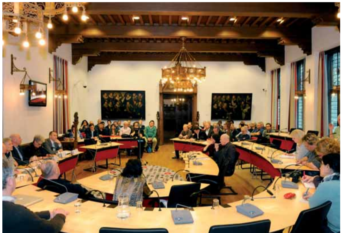
Voor de openbaarmaking van het coalitieakkoord en de wethoudersverdeling was grote belangstelling.

In het gepresenteerde coalitieakkoord 'Alkmaar beweegt' wordt de focus gelegd op het wensbeeld zoals dat in de visie Alkmaar 2030 is geformuleerd. Om dit toekomstbeeld (Alkmaar, levendige stad voor jong en oud, duurzame stad in het groen en hoofdstad van Noord Holland Noord) te kunnen bereiken, kijken de coalitiepartijen 'voorbij de crisis'. Dat betekent: investeren of welbewogen om te zorgen dat Alkmaar sterker uit de crisis komt. Maar tegelijkertijd houdt Alkmaar in deze crisistijd de financiën goed in de gaten: er wordt een sluitend financieel meerjarencade gepresenteerd waarbij de bezuinigingen van het Rijk worden verwerkt. Voor Alkmaar wordt verwacht dat er in de komende jaren 15 miljoen euro bezuinigd moet worden. Er is afgesproken dat belastingverhoging alleen in beeld komt als andere bezuinigingsmogelijkheden niet mogelijk zijn. Binnenkort wordt een publiek debat gehouden over het coalitieakkoord. De volledige tekst van het coalitieakkoord 'Alkmaar beweegt' (inclusief de volledige verdeling van de portefeuilles van het nieuwe college van burgemeester en wethouders) is te lezen op www.alkmaar.nl