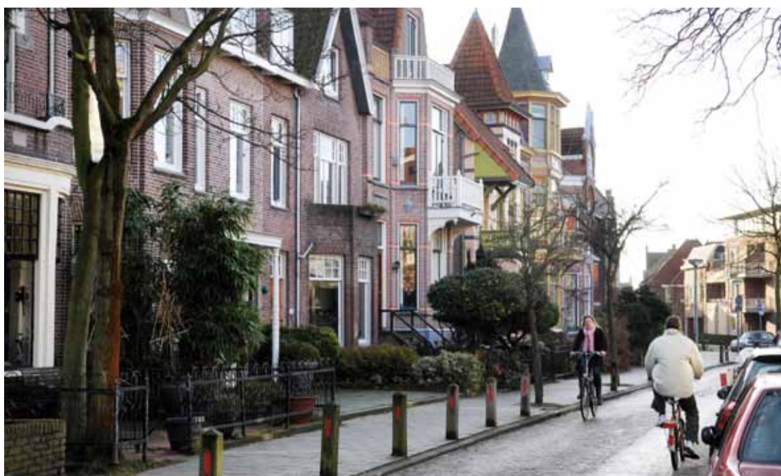
Woonlasten in Alkmaar zijn en blijven laag

WAAR WORDEN DE WOONLASTEN VOOR GEBRUIKT? De opbrengst van de OZB wordt gebruikt als algemene inkomsten voor de gemeente. Het is