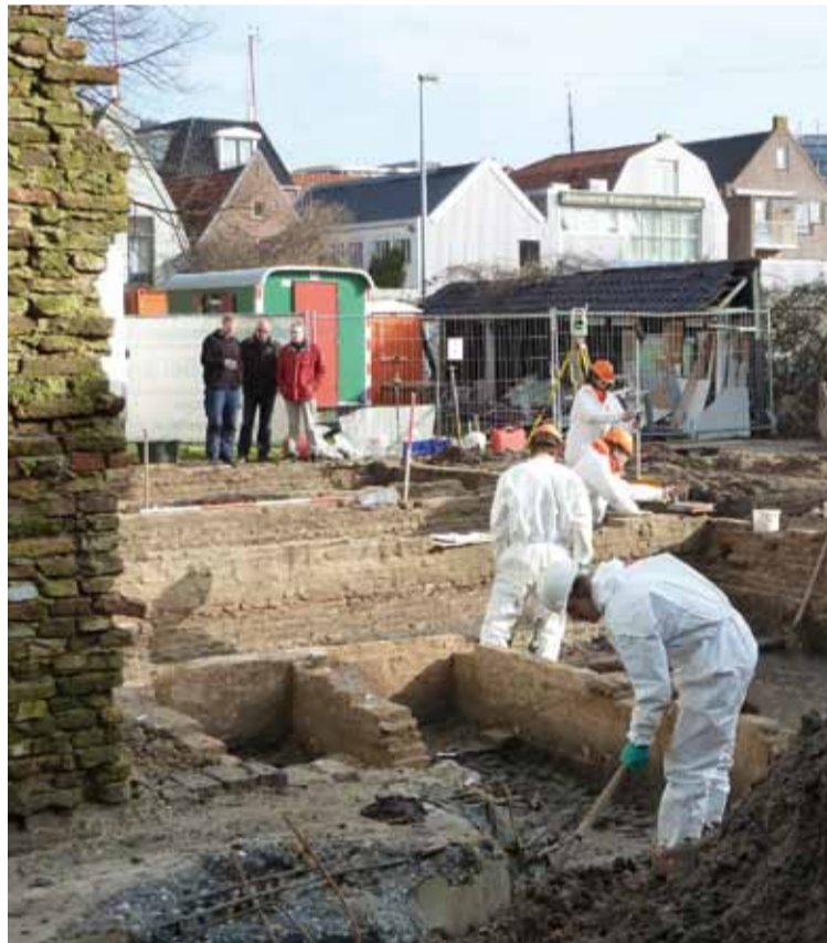
Het archeologisch onderzoek op het Doelenveld is in volle gang

Start: 10 januari 2011 Gereed: eind september 2011 In de Eilandenbuurt worden verschillende straten heringericht. Hierbij worden de straten per keer voor maximaal 80 meter opengebrouwen. Gele borden ter plaatse geven de omleiding aan. De sporthal blijft tijdens de werkzaamheden bereikbaar.