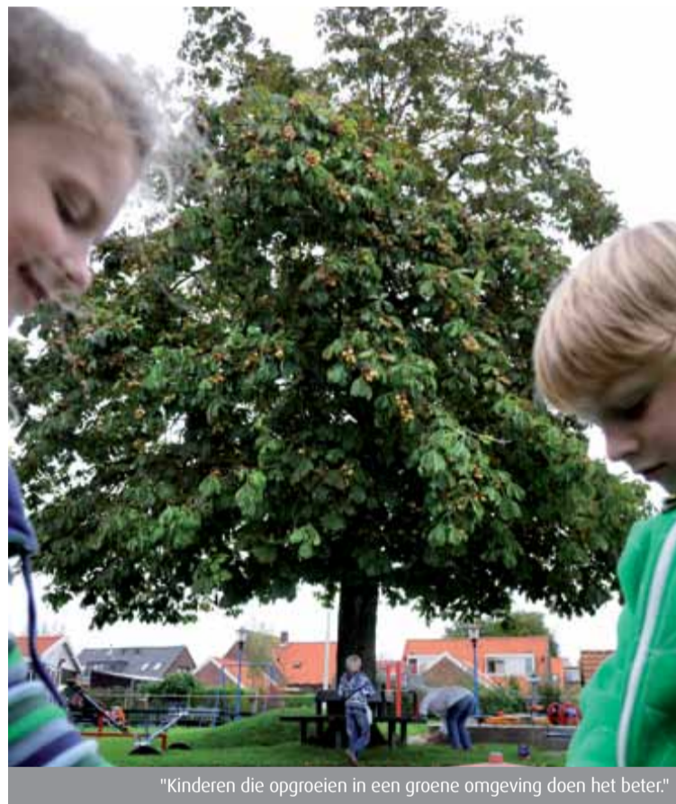
"Kinderen die opgroeien in een groene omgeving doen het beter."

Bij het planten van groen is er veel aandacht voor duurzaamheid. Zo kijkt de gemeente naar bomen die