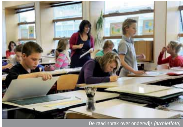
De raad sprak over onderwijs (archieffoto)

In juli 2011 heeft de gemeenteraad een motie aangenomen om een voorbereidingscommissie in te stellen, die met een voorstel zou moeten komen voor het organiseren van een raadsenquête in Alkmaar naar het bestuurs- en besluitvormingsproces rond het project Yxie. Afgelopen na jaar heeft de voorbereidingscommissie hiertoe een raadsvoorstel voorbereid. De gemeenteraad heeft op 12 januari besloten daadwerkelijk een enquêtecommissie, bestaande uit raadsleden, in te stellen. Eind dit jaar zal de enquêtecommissie klaar zijn met het onderzoekswerk. Dit betekent dat gedurende dit jaar het gehele proces en de gehele besluitvorming rondom Yxie zal worden onderzocht; hierbij bestaat ook de