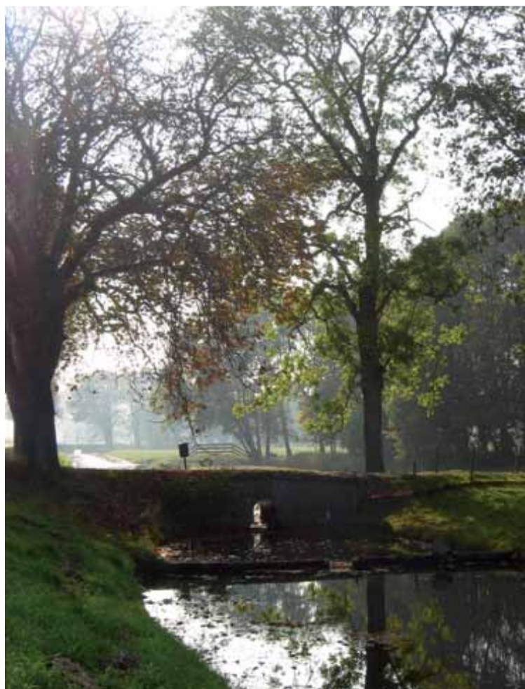
Zuidervaart op een vroege morgen.