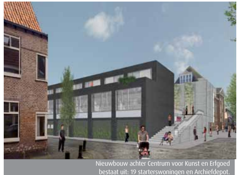
Nieuwbouw achter Centrum voor Kunst en Erfgoed bestaat uit: 19 starterswoningen en Archiefdepot.

een constante temperatuur en vochtigheid kan worden gehandhaafd. Daarbij is die kleine hoeveelheid energie ook nog eens afkomstig van een installatie met warmte-koudeopslag (WKO). Als alles volgens planning verloopt worden het nieuwe gebouw van het Regionaal Archief en de woningen in februari 2013 opgeleverd.