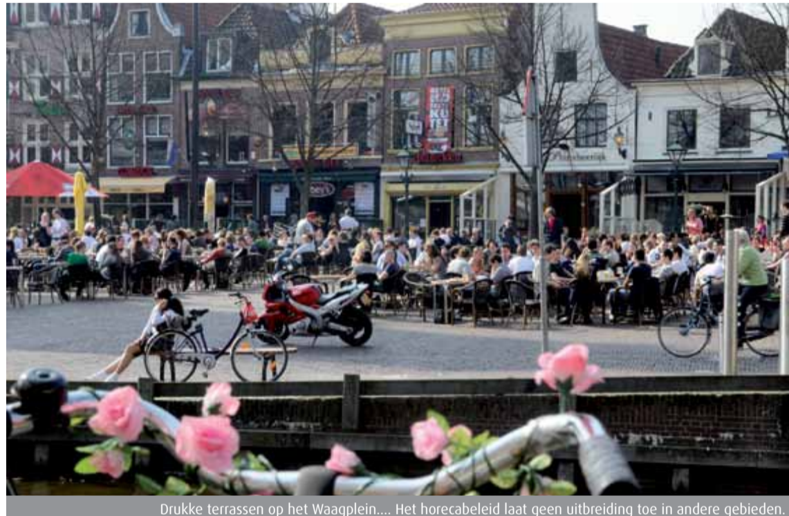
Drukke terrassen op het Waagplein.... Het horecabeleid laat geen uitbreiding toe in andere gebieden.

Om de veiligheid te verhogen, de veiligheidsgevoelens te verbeteren