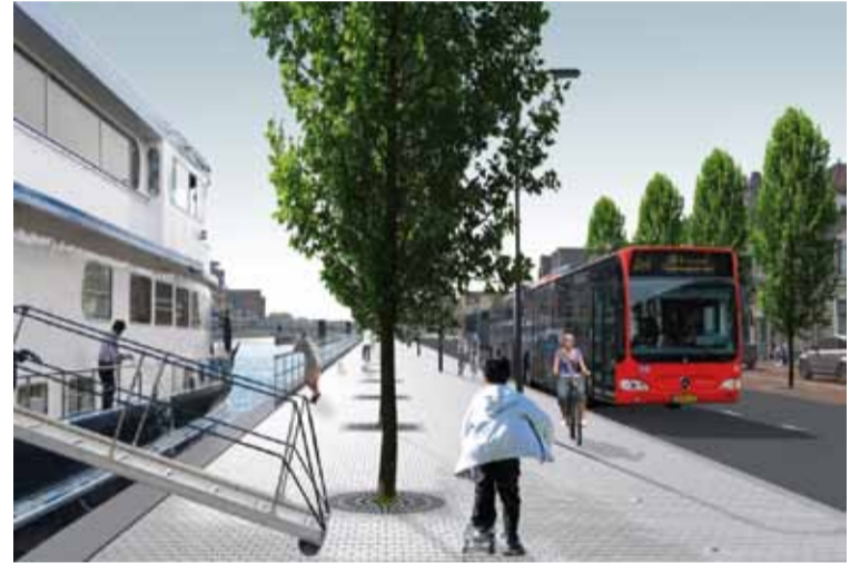
Een impressie van de nieuwe vrije busbaan op de Kanaalkade.

Helaas veroorzaken deze werkzaamheden in eerste instantie overlast. Om vervolgens na het gereedkomen van de gehele metamorfose ervoor te zorgen dat een optimale verbinding tussen Overstad en de bin-