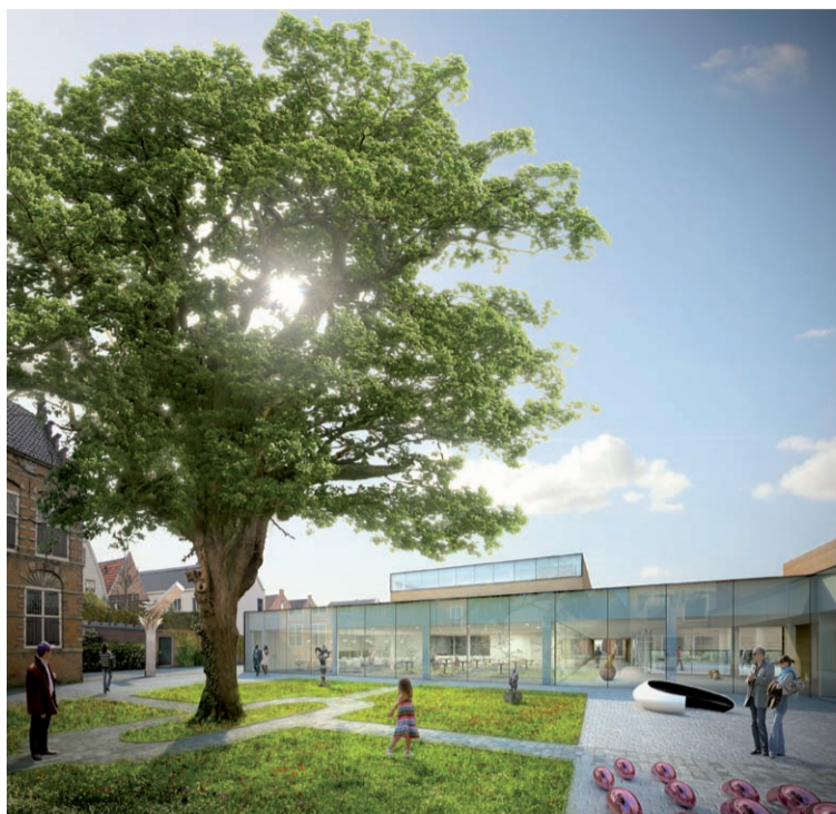
Een artist impression van het nieuwe Doelenveld. Recent is het plan in overleg met de omwonenden aangepast: de oppervlakte van het ontwerp is kleiner geworden en de bouwhoogte is verlaagd.