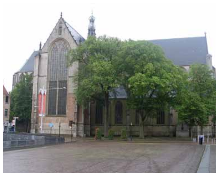
De Grote Kerk krijgt een nieuwe warmte-koude opslaginstallatie

Tijdens de commissievergadering SOB van 24 mei waren alle fracties hiervan een groot voorstander. Te meer omdat door de sloop van de hallen het mogelijk wordt jongerenwoningen te realiseren op Overstad.