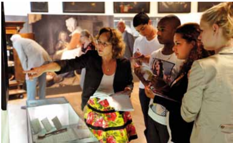
Samen met jongeren op DIY-tour

Familie, die meestal devoot zijn en al doordrongen lijken van de toekomstige zware opgave. Juist deze andere invalshoek maakt het schilderij voor mij zo boeiend. Het is een blij gezin dat geluk uitstraalt, prachtig!”