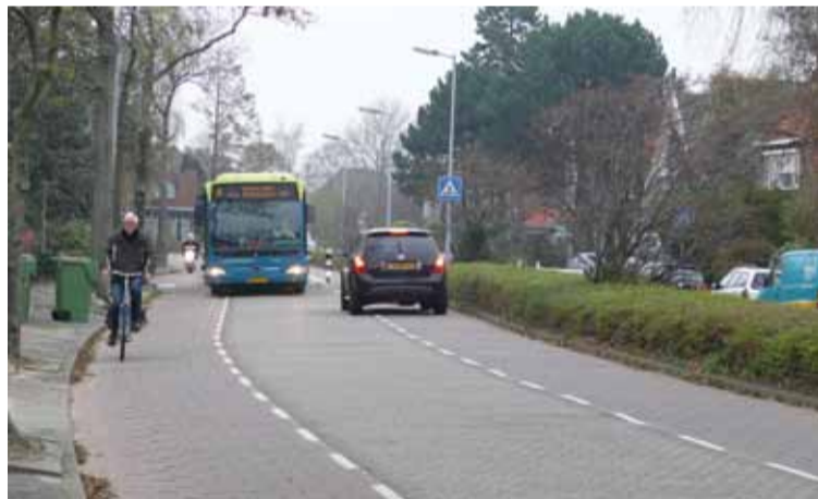
De raad heeft ingestemd met een krediet van circa 1 miljoen euro om maatregelen te nemen tbv de verkeersveiligheid, het fietscomfort en de afname van trillingen van de Frieseweg.

Tenslotte werd nog gestemd over drie moties. Een motie van D66 en CDA om het college te vragen om te onderzoeken of een andere (externe) bezwaarschriftencommissie mogelijk is werd unaniem aangenomen. Een motie van GroenLinks, waarin werd gevraagd om twee kraanwatertappunten in de stad aan te leggen, werd eveneens unaniem gesteund. Een motie van de VVD om het college te verzoeken om te kijken of het mogelijk is om bijstandsuitkeringsgerechtigden in brede zin te betrekken bij maatschappelijke taken en daarbij sneeuwoverlast als praktische start te gebruiken, werd niet aangenomen. Vóór stemden de VVD en drie leden van OPA, te weten de heren Bijl, Ursem en Peters en tegen stemden de overige fracties, inclusief de overige OPA-leden.