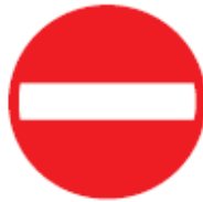
C2 Eenrichtingweg, in deze richting gesloten voor voertuigen, ruiters en geleiders van rij- of trekdieren of vee