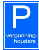
E9 Parkeergelegenheid alleen bestemd voor vergunninghouders