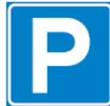
E4 Parkeergelegenheid Met onderbord arts of autodate.