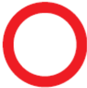
C1 Gesloten in beide richtingen voor voer- tuigen, ruiters en geleiders van rij- of trekdieren of vee