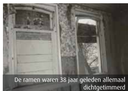
De ramen waren 38 jaar geleden allemaal dichtgetimmerd

maar dat zat ook niet in onze portemonnee! Geen probleem hoor, want wij zijn er als familie heel goed in om rijk te leven met weinig middelen."