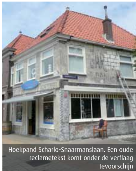
Hoekpand Scharlo-Snaarmanslaan. Een oude reclametekst komt onder de verflaag tevoorschijn