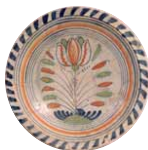
Majolicabord gevonden op het Canadaplein in 1998

vindt u een bijzonder aardewerken exemplaar, met een vernuftige werkwijze (zie ook de achterpagina).