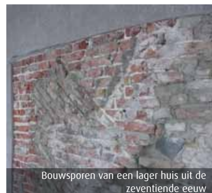
Bouwsporen van een lager huis uit de zeventiende eeuw

kleuren van het stucwerk. Er is in die tijd dus geen geheel nieuwe gevel gemaakt, maar de bestaande gevel is aangepast.