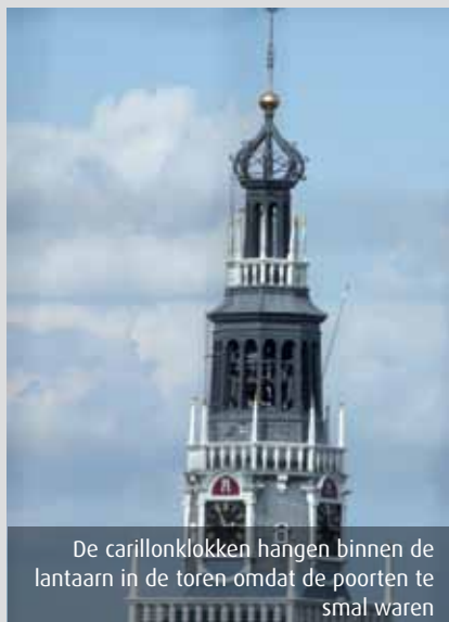
De carillonklokken hangen binnen de lantaarn in de toren omdat de poorten te smal waren

In de jaren zestig van de vorige eeuw is de hele mechaniek van het automatisch spel van de Waag al eens grondig gerestaureerd (op de bijgaande foto is de naam van de firma Eijsbouts te lezen en het jaar 1968). Deze restauratie was onderdeel van een grotere restauratie van de carillons van Waag én Grote Kerk. In het Regionaal Archief zijn de wederwaardigheden van die ingrijpende operatie goed gedocumenteerd. De archiefstukken laten zich lezen als een zich jarenlang voortslepende soap. Terwijl