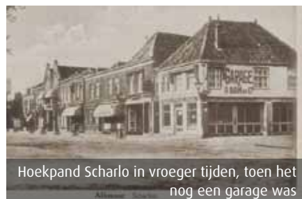
Hoekpand Scharlo in vroeger tijden, toen het nog een garage was