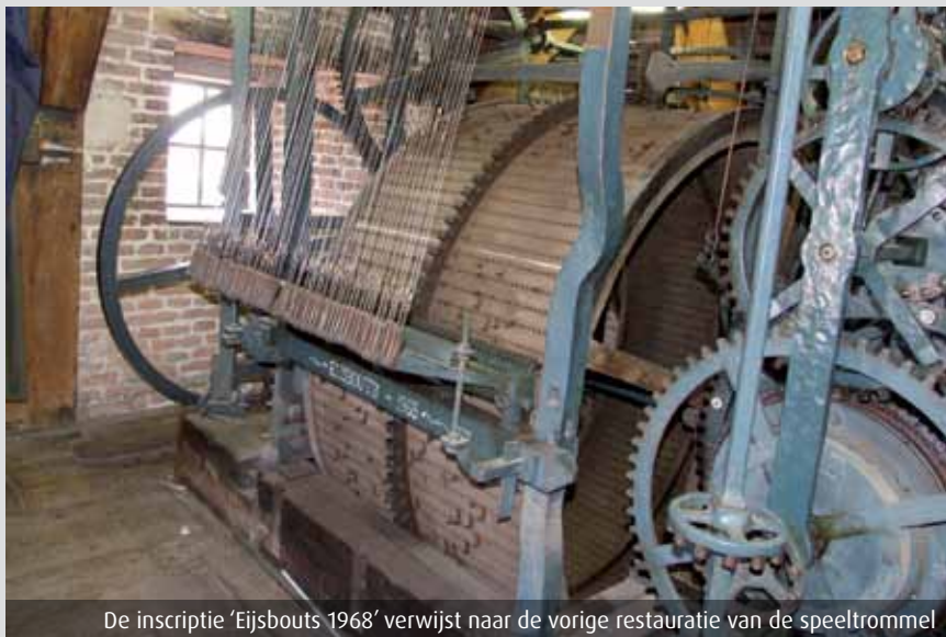
De inscriptie 'Eijsbouts 1968' verwijst naar de vorige restauratie van de speeltrommel