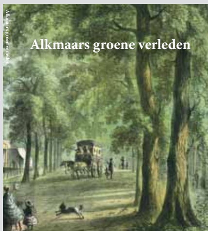
Alkmaars groene verleden

Op zondag 9 september kunt u meewandelen met de gratis Groen van toen-wandeling over het bolwerk en door de Hout. Gidsen van de Historische Vereniging Akmaar vertellen dan onder meer over pleziertuinen en tuinkoepels. Gidsen met groenkennis leren u alles over de bijzondere bomen die u onderweg passeert. Start van de wandeling is om 14.00 uur in het park, bij het beeld van de herder bij de Bergerbrug. Aanmelden kan via de website www.alkmaar.nl/openmonumentendag of op 8 september bij de stands van de gemeente en de Historische Vereniging in de Grote Kerk.