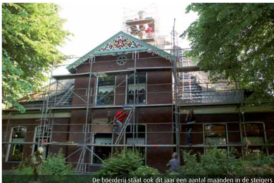
De boerderij staat ook dit jaar een aantal maanden in de steigers

Jaren van veel werk dus, maar was het ooit af? Piet: "Nee, haha, dat zit niet in mij als persoon