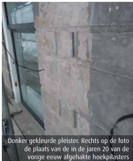
Donker gekleurde pleister. Rechts op de foto de plaats van de in de jaren 20 van de vorige eeuw afgehakte hoekpilasters