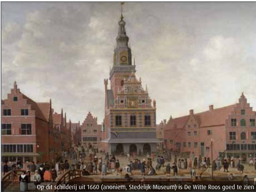
Op dit schilderij uit 1660 (anoniem, Stedelijk Museum) is De Witte Roos goed te zien

vloerdelen tot wel 40 centimeter breed. Een grove den (de leverancier van het grenenhout) is breed bij de wortels en smal in de kruin. Om het verschil in breedte op te vangen, werden de delen kop-staart gelegd, dus breed tegen smal en andersom. Afgezien van de vloer, is al het aangetroffen houtwerk