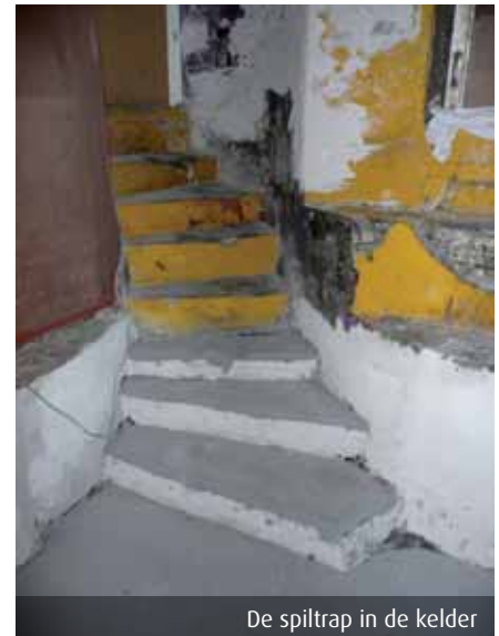
De spiltrap in de kelder