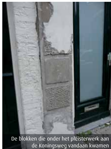
De blokken die onder het pleisterwerk aan de Koningsweg vandaan kwamen