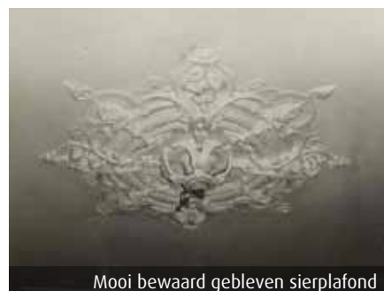
Mooi bewaard gebleven sierplafond

Helaas zijn de steigers niet op tijd opgeruimd om op Open Monumentendag open te gaan, maar volgend jaar geven Piet en Corrie bezoekers van de Open Monumentendag graag een rondleiding in hun boerderij.