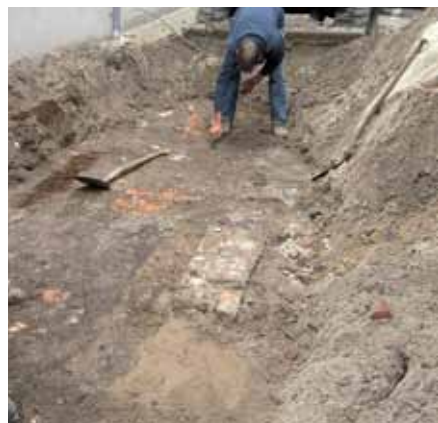
De 14de-eeuwse kleivloer met drie baksteenpoeren voor staanders van een huis

Het archeologisch onderzoek bij het voormalige bankgebouw is gedaan in de kleine bouwput die ontstond voor het realiseren van een nieuwe ingangspartij in de voormalige steeg die achter de bank langs liep. Helaas bleek het kleine onderzoeksterrein deels verstoord te zijn door de bouwactiviteiten van een eeuw geleden. Wat resteerde was een