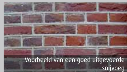
Voorbeeld van een goed uitgevoerde snijvoeg

De grijze kleur die we helaas ook af en toe zien is een modeverschijnsel van de laatste tijd en is niet historisch juist. Alleen bij bebouwing uit de jaren twintig en dertig van de vorige eeuw komen we grijze of roodbruine voegen tegen.