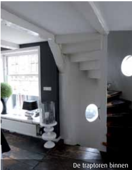
De traptoren binnen

vloerdelen tot wel 40 centimeter breed. Een grove den (de leverancier van het grenenhout) is breed bij de wortels en smal in de kruin. Om het verschil in breedte op te vangen, werden de delen kop-staart gelegd, dus breed tegen smal en andersom. Afgezien van de vloer, is al het aangetroffen houtwerk