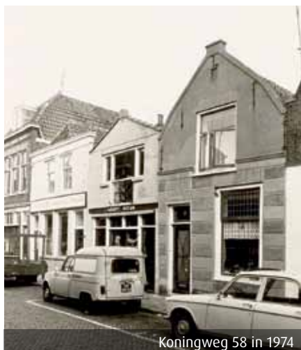
Koningsweg 58 in 1974

Dergelijke blokken worden ook wel rustica genoemd. Een verschijnsel dat is terug te voeren op voorbeelden uit de Italiaanse Renaissance. Grote pallazzi kregen daar op de begane grond een zeer gesloten basement van ruwe blokken om het pand een stevige robuuste basis te geven. Het fijne beeldhouwwerk van de verdiepingen stak dan ook mooi af tegen dit zogenaamde bruto werk. Waar in Italië werd gewerkt met echte ruwe gehakte natuursteen, werd hier in stucwerk geprobeerd hetzelfde robuuste effect te bereiken. De bewerkte stucwerkblokken zijn waarschijnlijk een imitatie van ruwe gebouchardeerde natuurstenen blokken. Boucharderen is de eerste stap van het glad maken van de steen na het splitsen van de grote