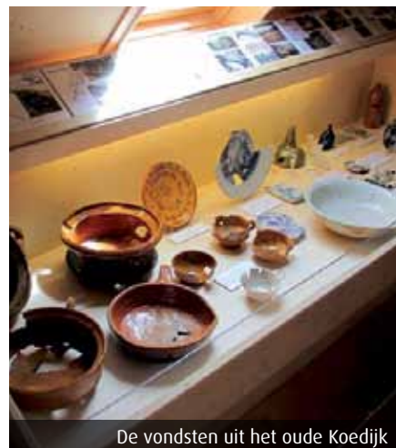
De vondsten uit het oude Koedijk

De toegang tot de expositiezolder is gratis (de molen zelf is niet gratis te bezichtigen).