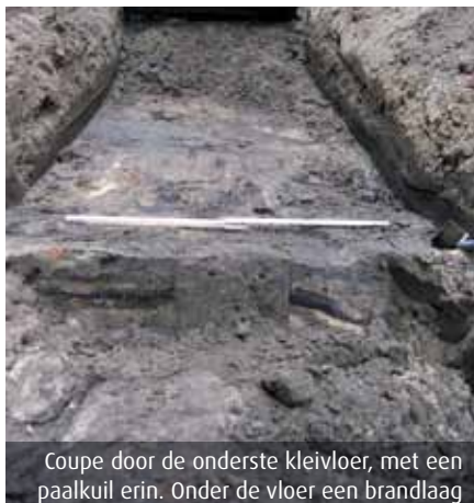
Coupe door de onderste kleivloer, met een paalkuil erin. Onder de vloer een brandlaag