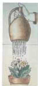
waterpot Lüneburg en werkwijze waterpot