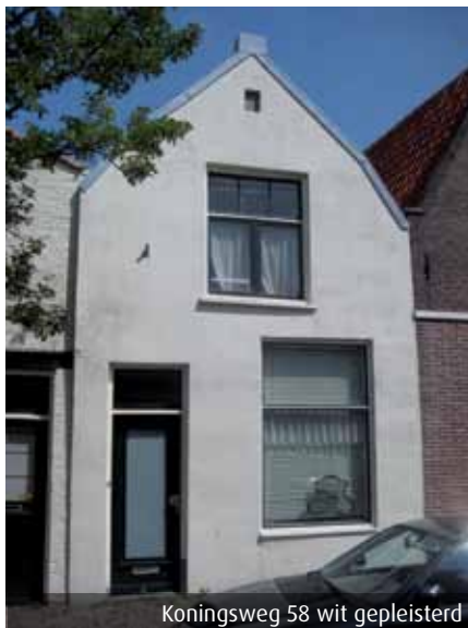
Koningsweg 58 wit gepleisterd

blokken. Dit gebeurde met een zogenaamde bouchardhamer, een soort grote vleeshamer met puntjes. De imitatie is waarschijnlijk gemaakt door met een bos riet in het licht aangedroogde stucwerk te stempelen.