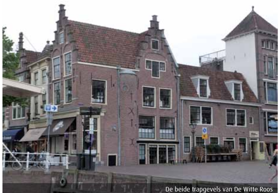
De beide trapgevels van De Witte Roos