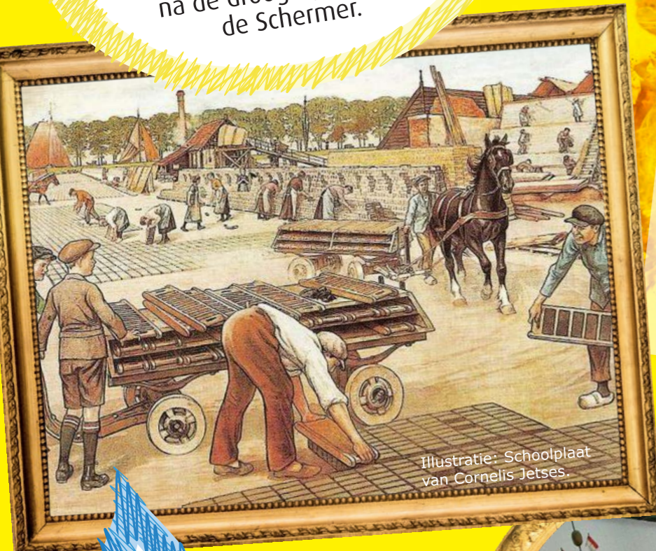
Illustratie: Schoolplaat van Cornelis Jetses.

Schermerhorn is een oud vissersdorp dat oorspronkelijk omsloten was door water. Het meer De Schermer is in de 17e eeuw drooggelegd met behulp van molens. Het landschap is toen ingrijpend veranderd.