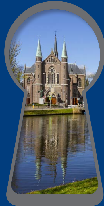
St Laurentiuskerk Oudorp