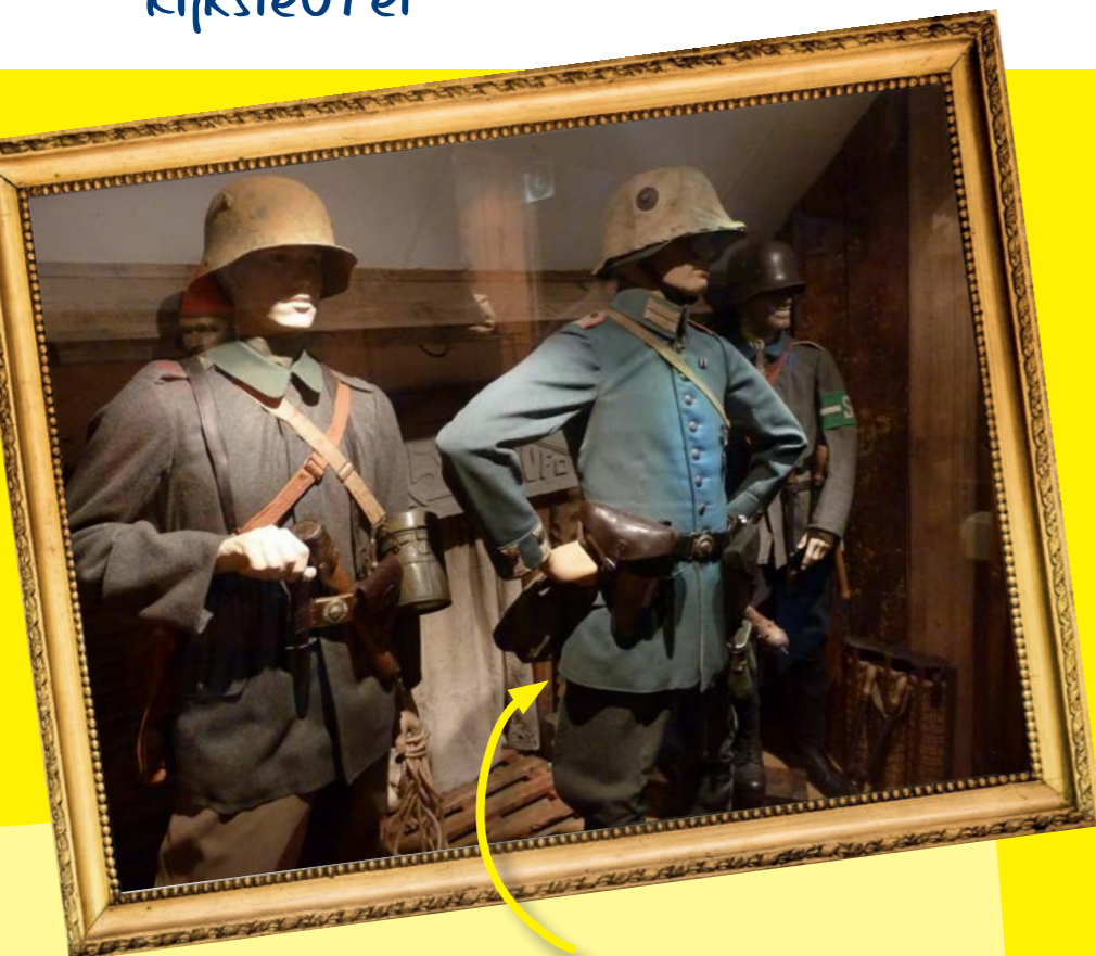
In de Eerste Wereldoorlog (1914-1918) zat hier een noodhospitaal voor Duitse soldaten. Op zolder kun je een blik werpen in het museum over deze oorlog.