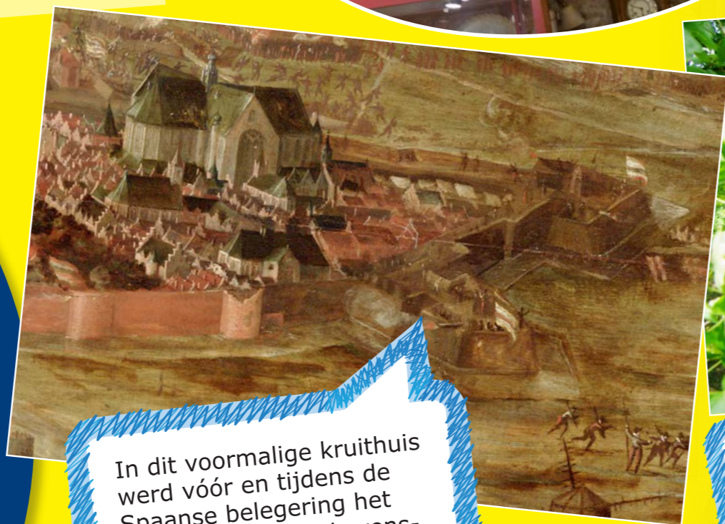
In dit voormalige kruithuis werd vóór en tijdens de Spaanse belegering het kruit opgeslagen. Levensgevaarlijk natuurlijk, explosieven midden in de stad!