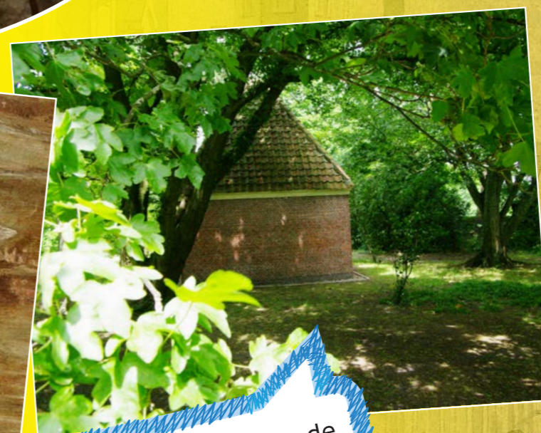
Uiteindelijk gingen de kruithuisjes naar de bolwerken, toen nog ver van de bewoonde wereld.