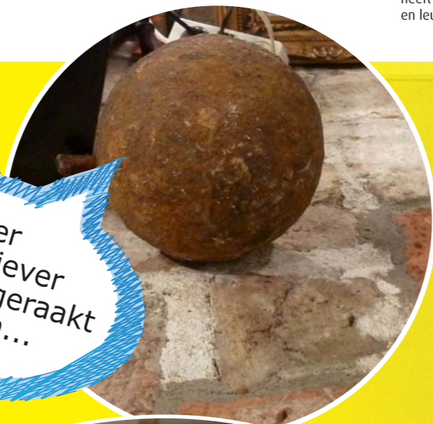
Hier wil je liever niet door geraakt worden...