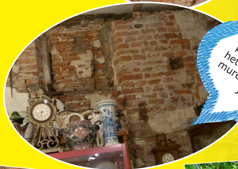
Aan het metselwerk kun je zien hoe oud het pand is. Sommige muren zijn honderden jaren oud!