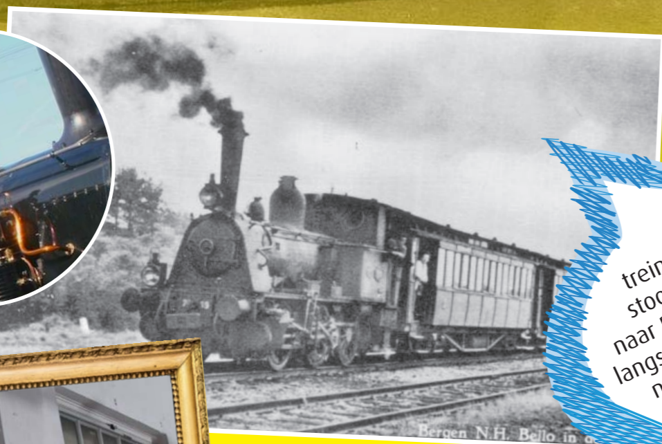
Bergen N.H. Bello in o...

Wie kent het treintje Bello? Dit was een stoomtram die van Alkmaar naar Bergen aan Zee reed en ook langs de Gasfabriek kwam! Mensen noemden hem Bello omdat er altijd een stoombel werd geBELD.