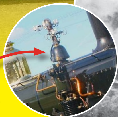
Bel van stoomtrein Bello